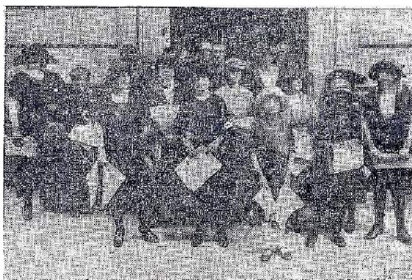
(El Liberal. 1 de junio de 1921)