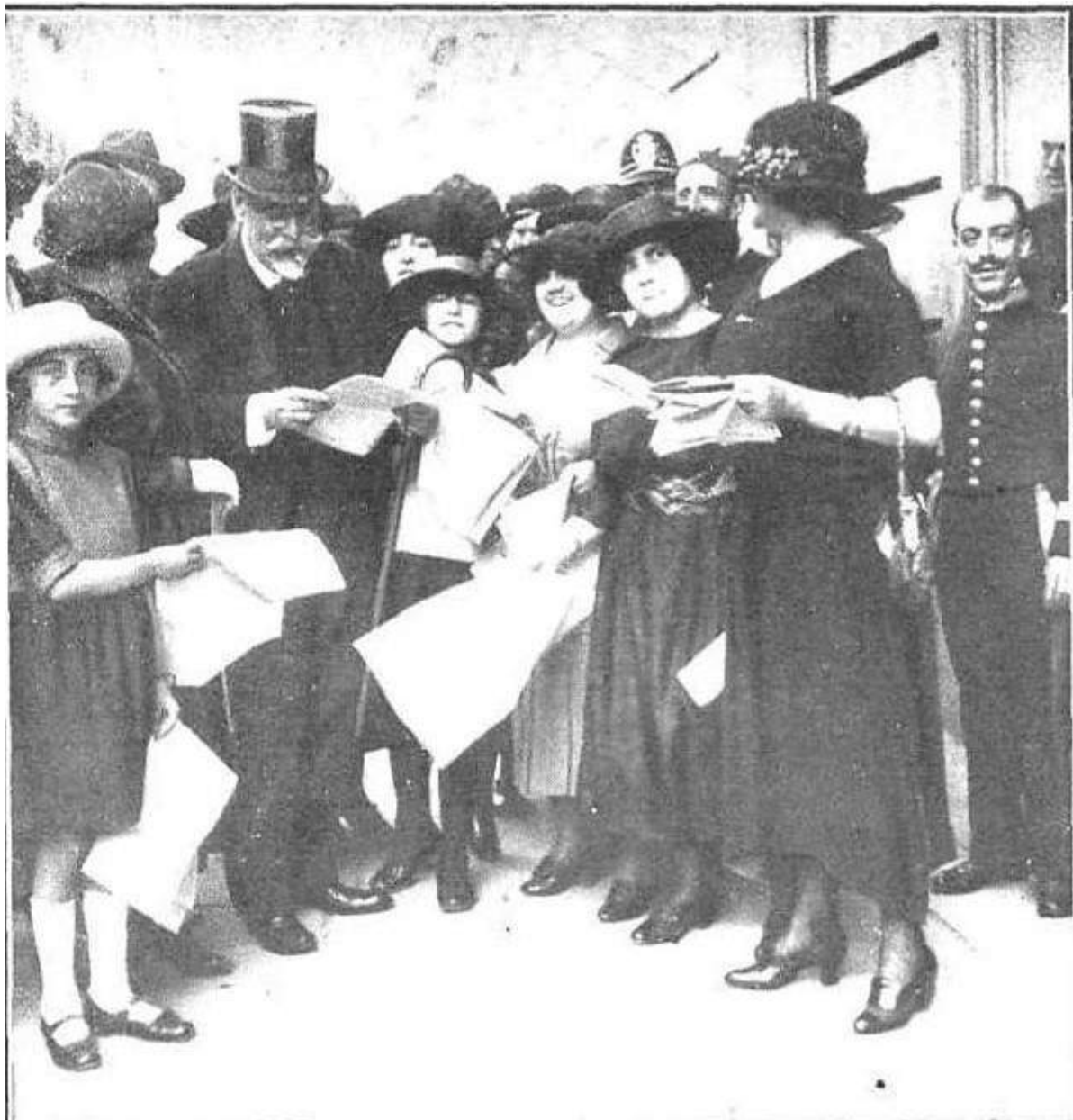
El Presidente del Consejo de Ministros leyendo atentamente el manifiesto de las sufragistas, que le ha sido entregado por las mismas en la puerta del Congreso (Revista Semanal, Mundo Gráfico. 8 junio 1921)

"El primer acto público de las sufragistas españolas"